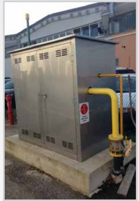
Box contatori Gas