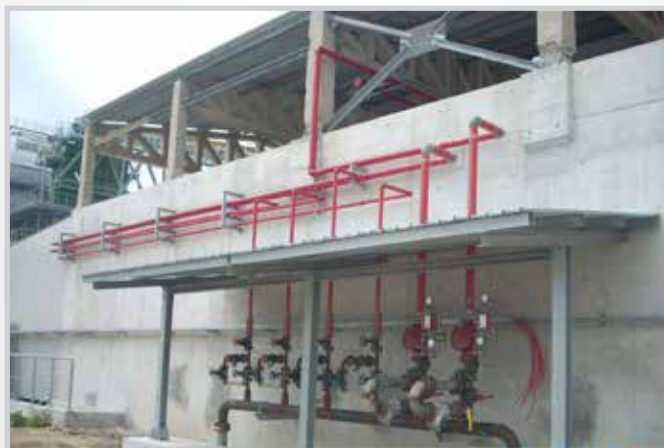
Tettoia per impianti antincendio