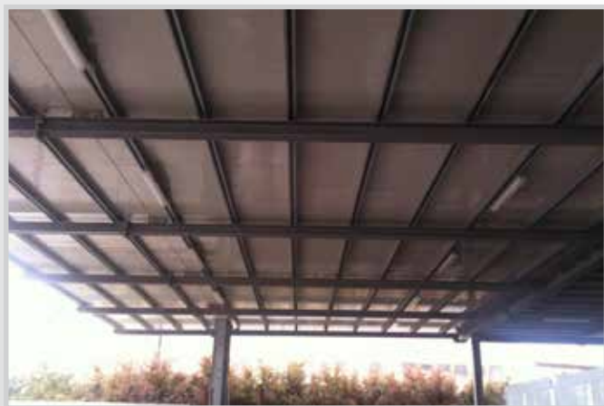
Tettoie grandi luci