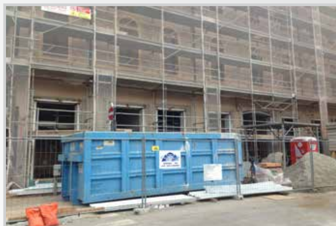
Cerchiatura vetrine e volti