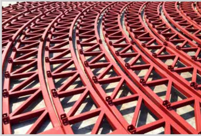
Capiate a volto