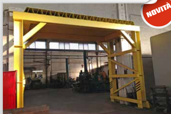
Punto di raccolta persone