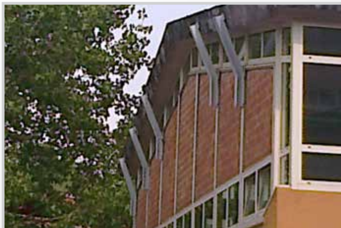
Adeguamento sismico scuola "Barozzi" - Modena