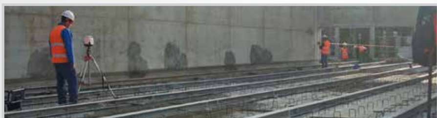
Fondazioni con carpenterie