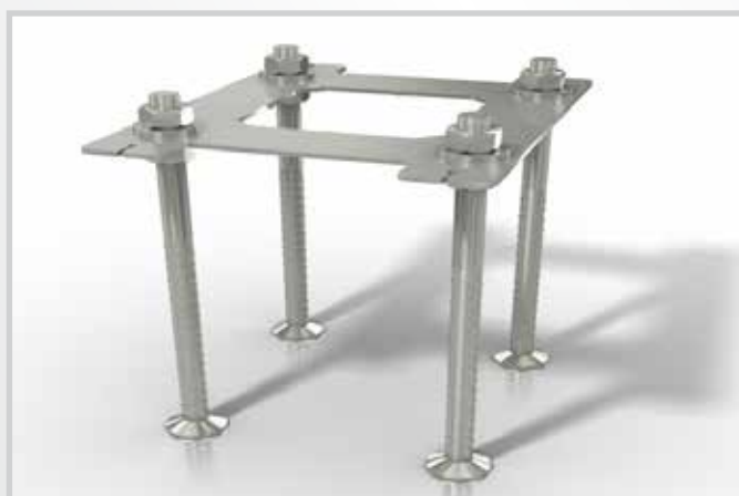
Dime di fondazione