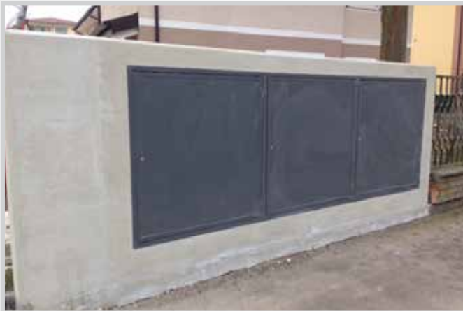
Portelli contatori Luce