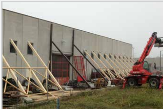
Messa in sicurezza capannoni