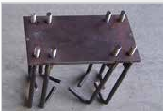
Piastre e tirafondi