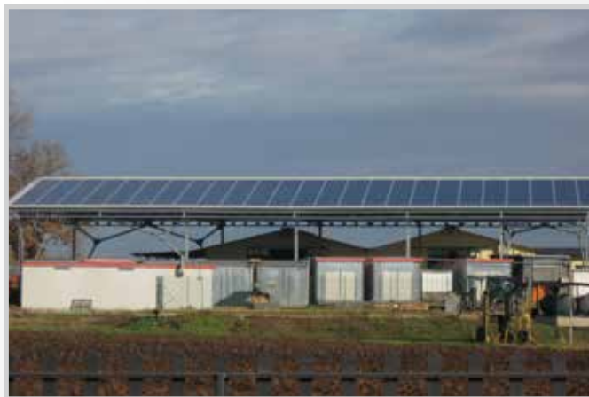
Capannone agricolo con fotovoltaico