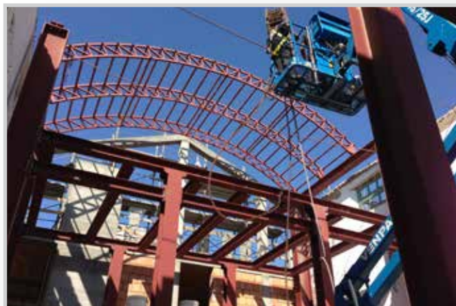
Struttura ex fabbrica pomodoro Nonantola (MO)