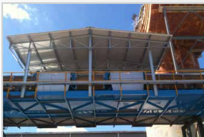
Carpenteria per tettoie