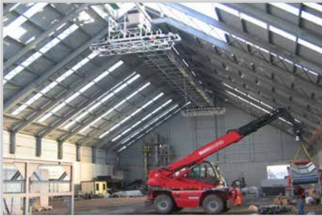
Hangar e magazzini portuali