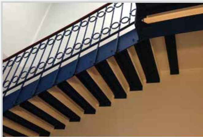
Scale interne metallo