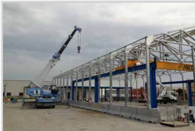
Portali per carriponte