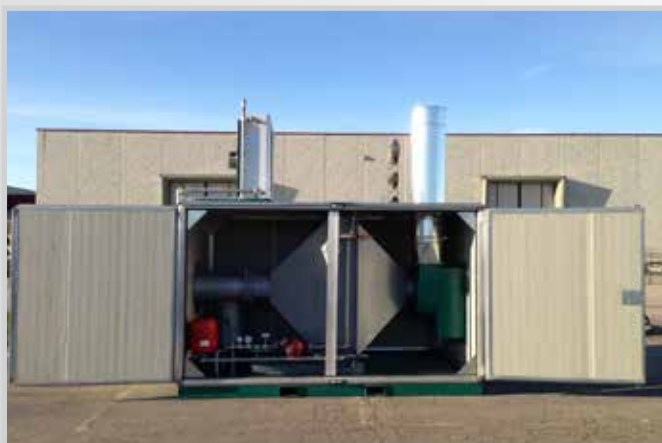
Box isolamento termico