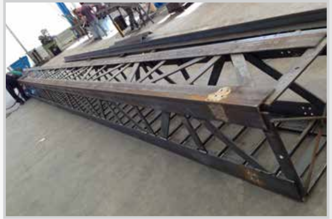
Struttura torre ex fabbrica pomodoro Nonantola (MO)