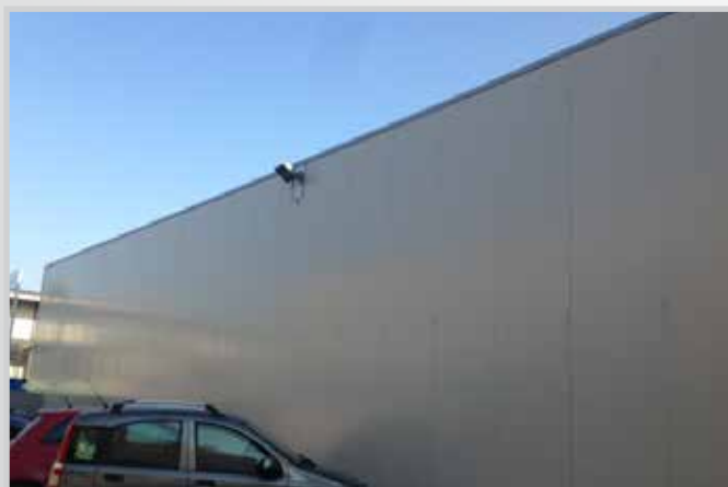
Pannellatura esterna capannone