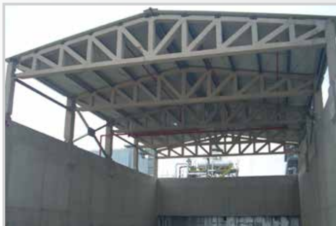
Copertura magazzino stoccaggio