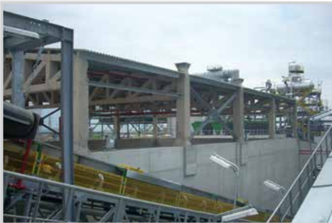
Strutture grandi impianti industriali