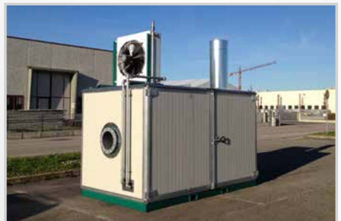
Box isolamento acustico