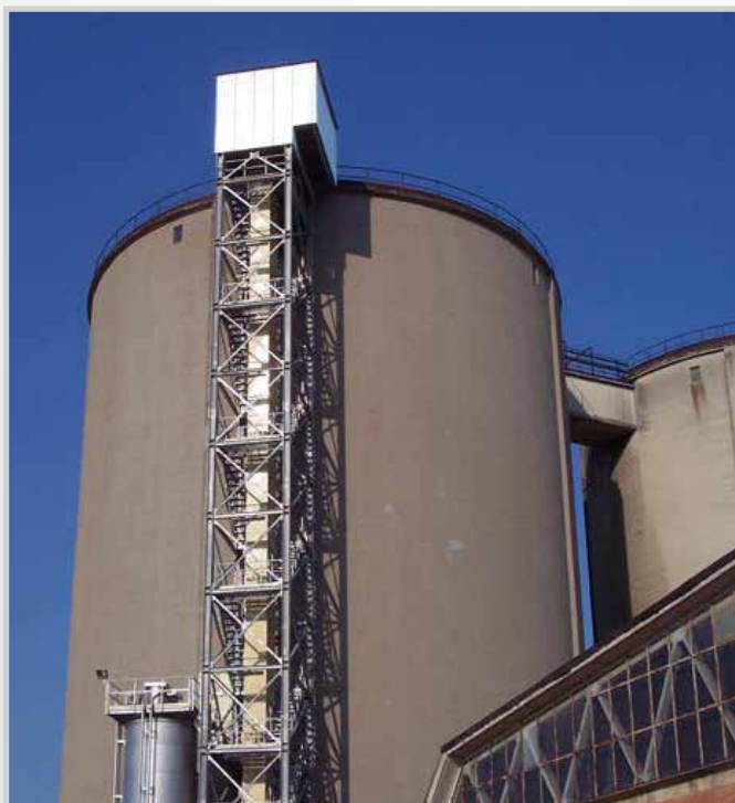
Torri per scale industriali