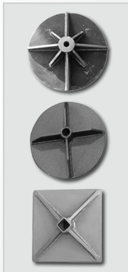
Capichiave a stella, tondo e quadrato