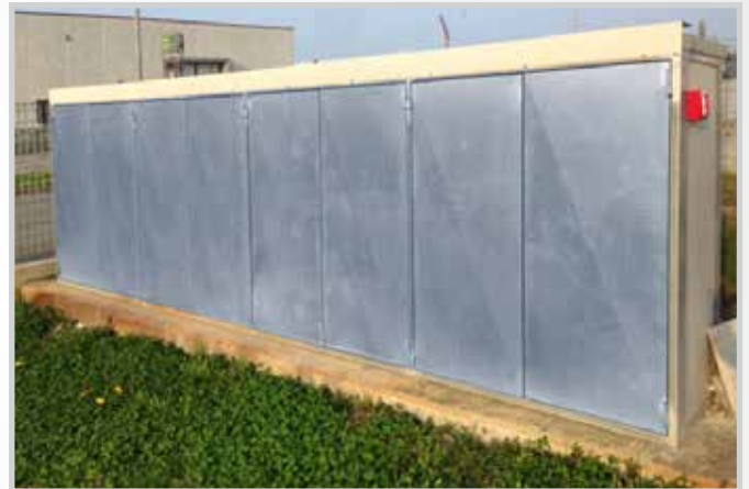
Box contatori Luce