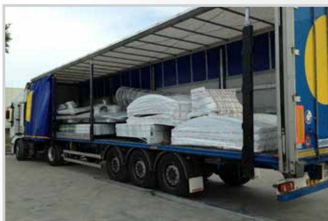
Trasporto in cantiere