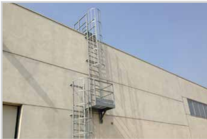
Scale alla marinara e ballatoi intermedi