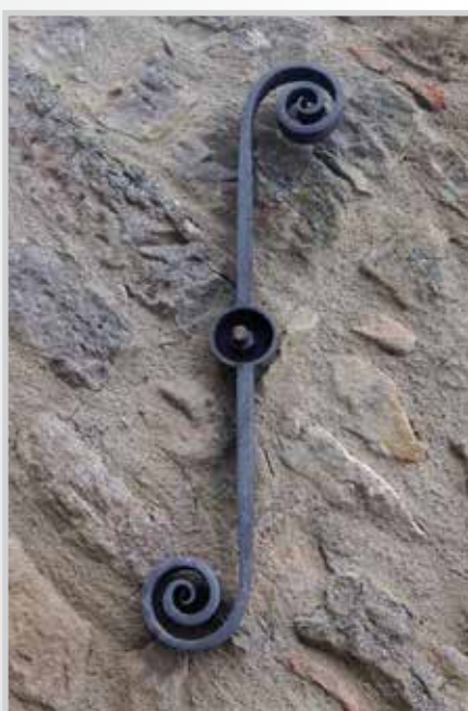
Capochiave a chiave di violino