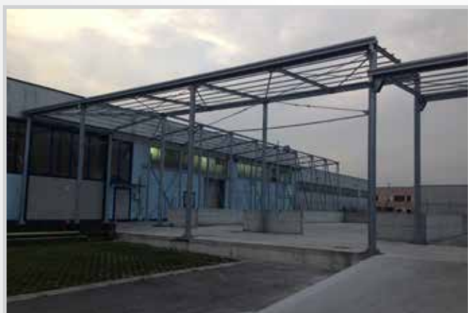
Tunnel di passaggio e corridoi tecnici