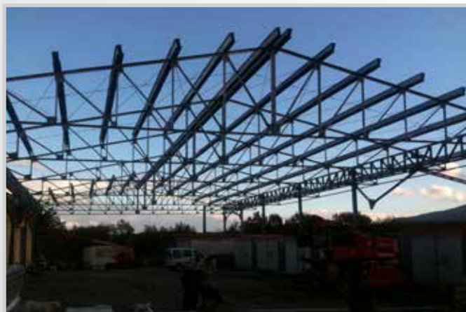
Struttura reticolare capannone