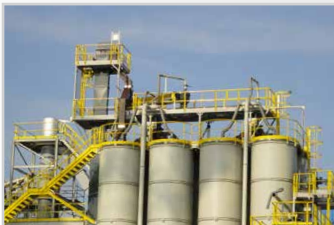
Scale, ballatoi e parapetti