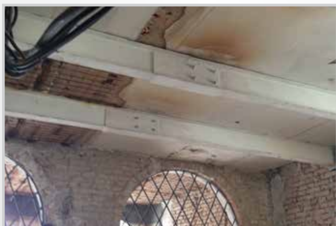
Travi per consolidamento solaio