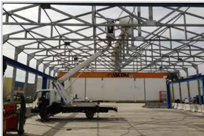
Struttura capannone in tubolare